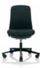
HÅG SoFi 7202 con schienale completamente imbottito