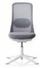
HÅG SoFi 7502 con schienale in rete grigio(MEH002)