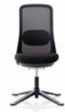
HÅG SoFi 7502 con schienale in rete nero (MEH001)