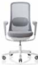
HÅG SoFi 7500 con schienale in rete grigio (MEH002)*