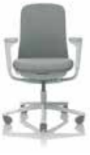
HÅG SoFi 7200 con schienale completamente imbottito*