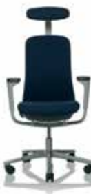
HÅG SoFi 7300 con schienale completamente imbottito e poggiatesta*/**