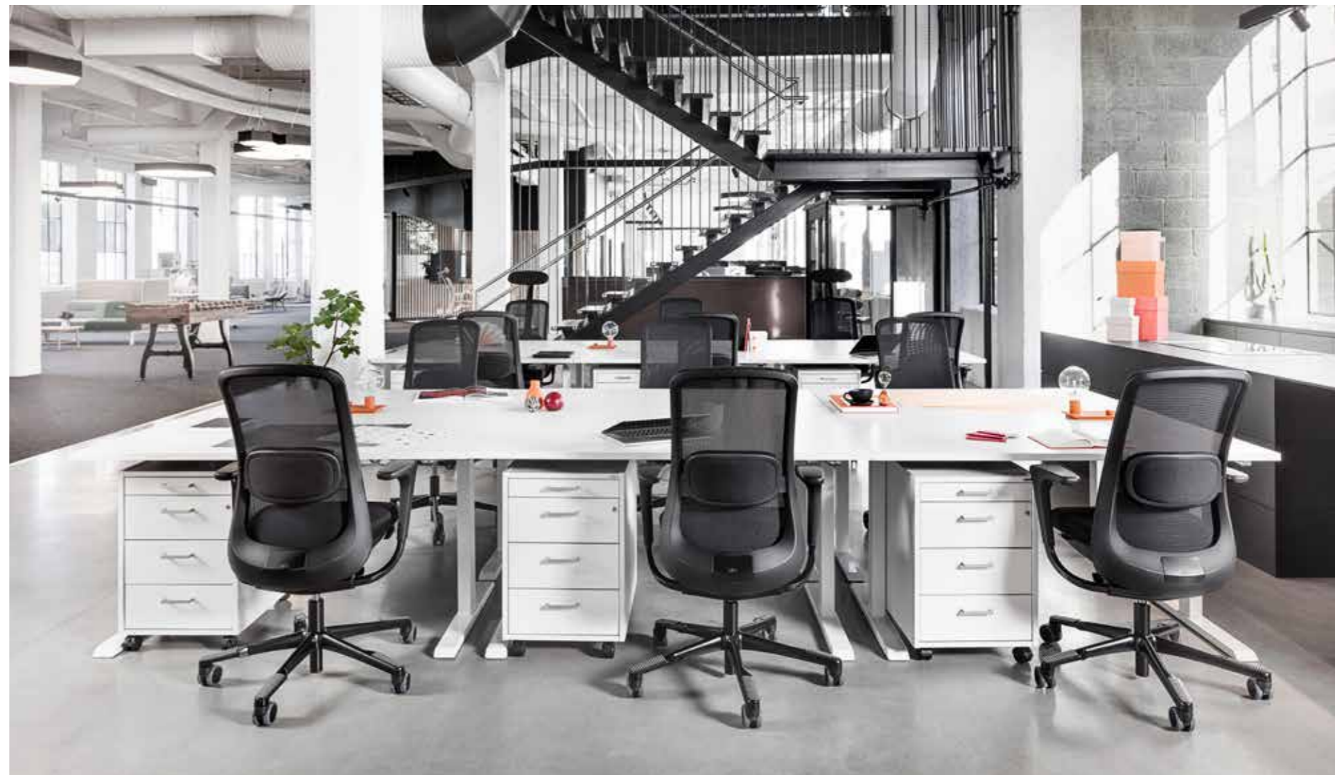
HÅG SoFi 7500 con schienale in rete nera (MEH001). Tessuto: Note 60999 di Gabriel.