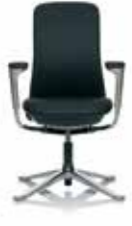
HÅG SoFi 7302 Polished Exclusive*