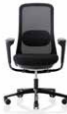
HÅG SoFi 7500 HÅG SoFi 7500 con schienale in rete nero (MEH001)*