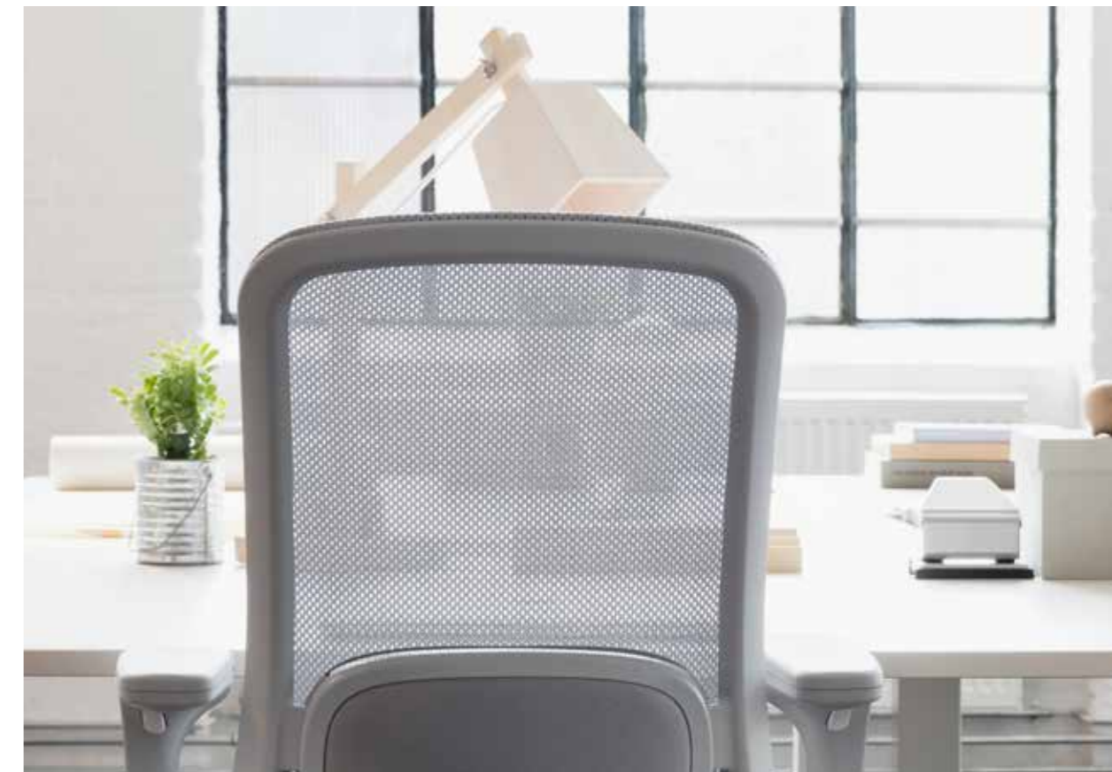
HÅG SoFi mesh 7500 con schienale in rete grigio (MEH002). Tessuto: Nexus Pewter 01 di Camira.